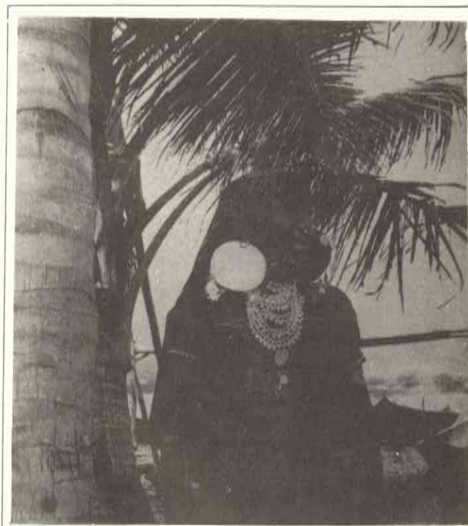
Indígena kuna. San Blas, Panamá.